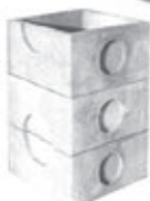
Pozzetto Milano assemblato