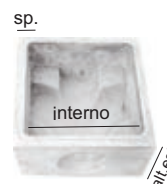
Elemento di fondo

Identica classificazione consultabile nel Catalogo Web